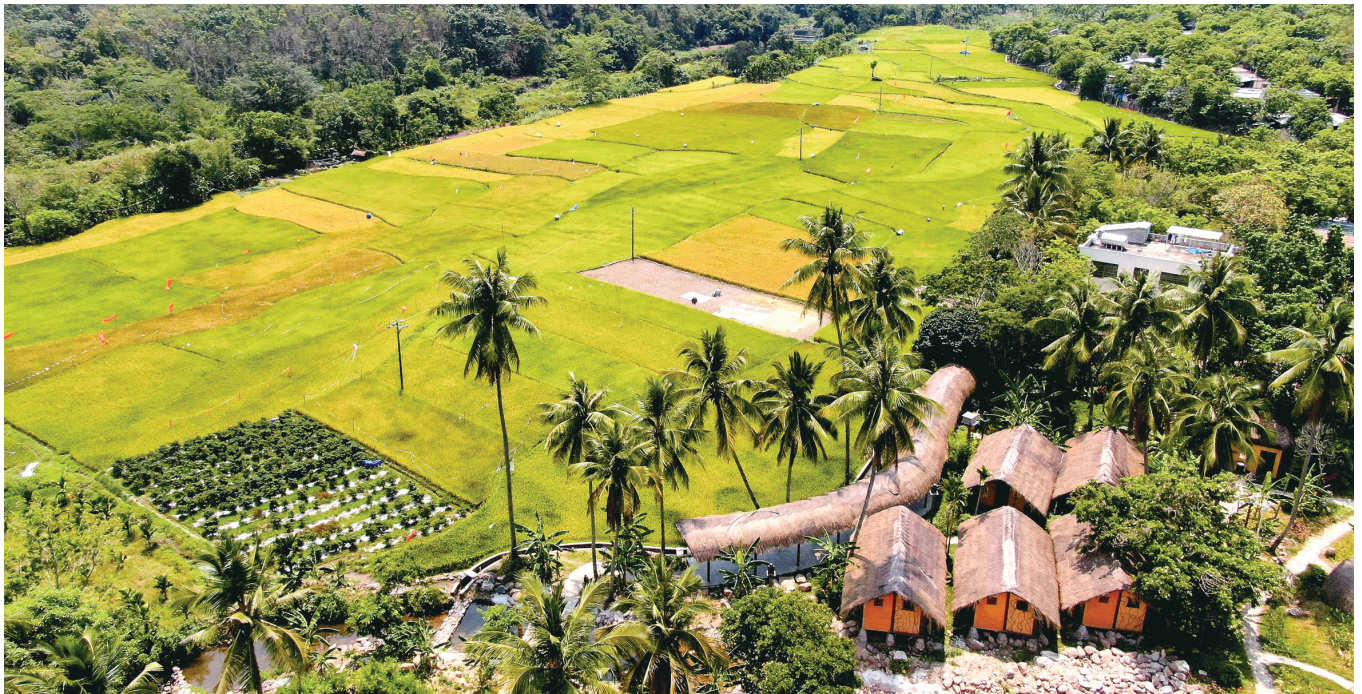
俯瞰昌江王下乡洪水村田园风光。

昌江在石碌镇山竹沟村、叉河镇红阳村开展试点示范,建立了量化考评体系,成为近年来海南省结合实际创新乡村治理模式的有效尝试。